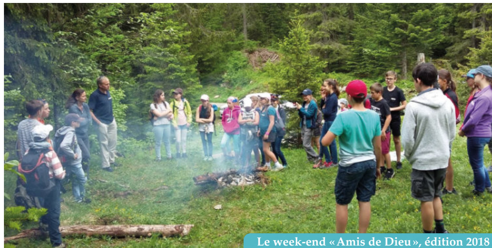
Le week-end « Amis de Dieu », édition 2018